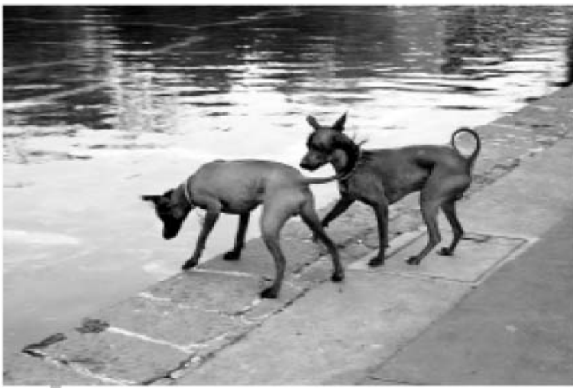
XOLOESCUINTLES. De recreo en CU.

¿VIDAS PARALELAS? En Ingeniería.