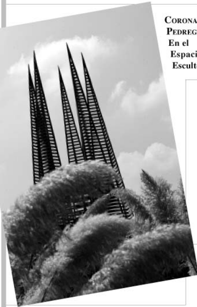
CUERNAVACA. Centro de Ciencias Genómicas.