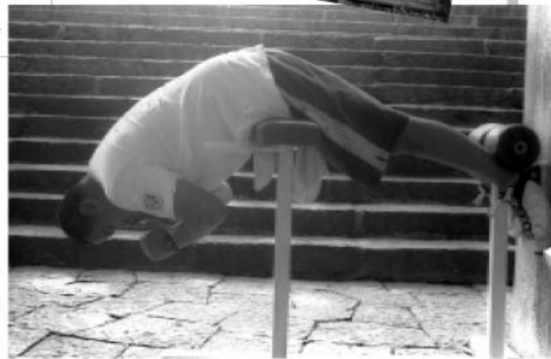
ACONDICIONAMIENTO. Ejercicios matinales.

CORONA DEL PEDREGAL. En el Espacio Escultórico.